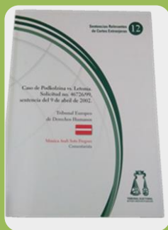
Pag.75 México 2016

En la presente obra se estudia la exclusión de una nacional de Letonia de la lista de aspirantes al Parlamento, por el supuesto desconocimiento del idioma letón. El Tribunal Europeo de Derechos Humanos, al percatarse de la incorrecta aplicación de la medida legislativa, condena al Estado de Letonia a indemnizar a la ciudadana, por considerar que restringió sus derechos políticos electorales cuando intentaba formar parte de una minoría parlamentaria.