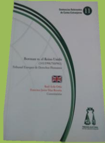
Pag.144 México 2016